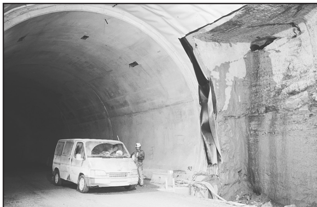
Etude d'un karst recoupé par le tracé de l'autoroute A5 au-dessus de St-Aubin-NE (Maître d'oeuvre: Département de la Gestion du Territoire du canton de Neuchâtel).

Une série de travaux plus ponctuels ont été également effectués: deux après-midi de cours sur le karst et les